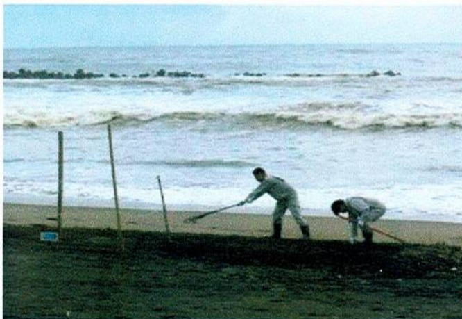
ウミガメ産卵巣を守る市職員(10/29)

産卵6ヶ所で、うち5ヶ所で孵化し子ガメが無事旅立ちました。6番目産卵巣(8月26日、和泉浦)は、9号台風と20号台風で共に冠水しましたが産卵巣は流出せずに無事でした。