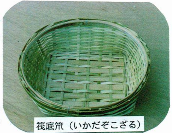
筏底箆(いかだぞこざる)

底編みは、最初底の下面を上に向けて編みます。タテ芯になるヒゴを1.5 cm間隔に7本縦に並べて、手前の部分を膝で押さえます。次にタテ芯の1本を横に編み込みます。ついで、伸子を1本並べて左端と右端がタテ芯の下になるように編み込みます。その後、タテ芯、伸子と交互に、それぞれ7本と6本を隙間のないように編み込みます(右の写真参照)。こうして底の部分ができ上がります。続いて、皮竹のヒゴ(編み竹)を用意して、底の部分を固定するとともに、立ち上がる(腰上げ)部分を編みます。次は、胴編みです。今度は、底の下面を下にして、ヒゴ(肉竹または皮竹)を用いて隙間無く、予定した深さ(8 cm)になるまで編み上げていきます。これで、胴編みは終了です。ここまでくると、箆らしくなってきます。