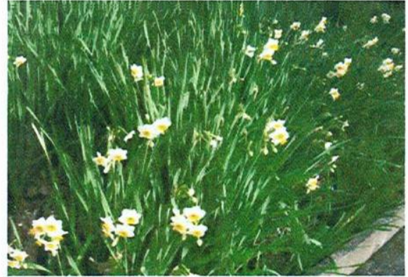
手入れ十分な水仙の花 (三門 12/26)

当地で新春に見られる花に水仙、菜の花、椿などがあります。毎年歳末に三門の知人から頂く水仙は手入れが十分なため切花が長持ちし部屋中かぐわしい香りで満たされて気持ちよく年頭を過ごしています。日当たりのよい畑では、路地栽培の菜の花が澄み切った冬空のもと黄色の花を咲かせています。椿は種類が多く、まだ蕾が膨らんだままのものに混じり、藪椿の大木が樹冠まで樹の周り一面に花を付けているのに出会います。