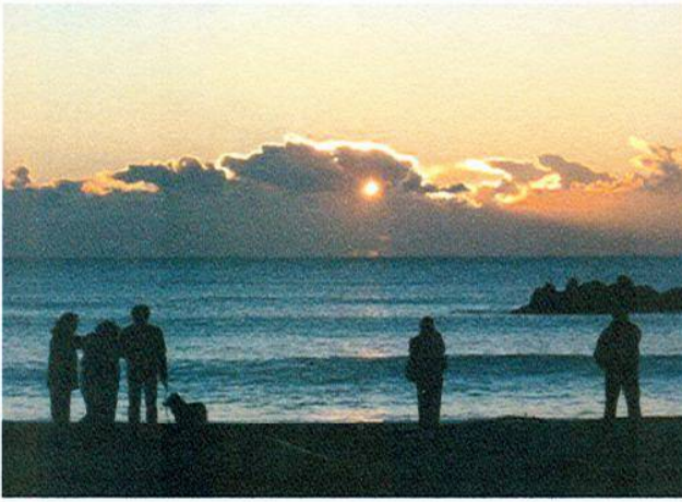
海岸の初日の出風景(日在浦海岸 1/1)