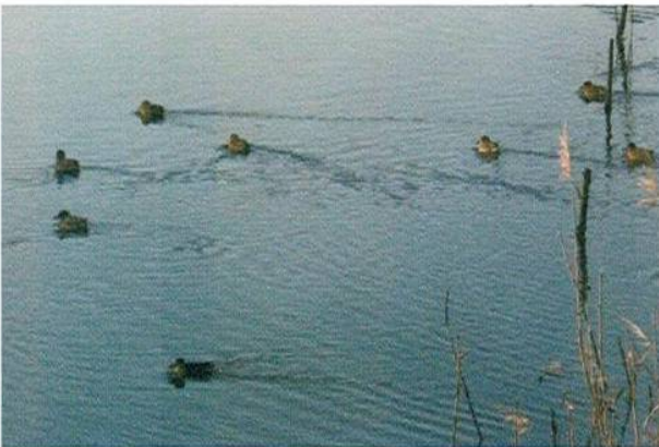
コガモの群れ(日在瀉12/21)