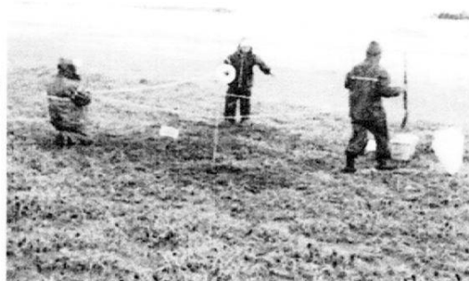
2回目産卵巣は2m高い台地へ移設 市水産班による雨中の作業(6/22)

今年2回目のウミガメ上陸の足跡は6月22日、日在玉前神社前の海岸で近くの住民により発見されました。市水産班よりの連絡で、雨中の夕刻 筆者は産卵の確認に立ち会いました。産卵場所が低い地点で海が荒れると冠水するため、課長と水産班職員は直ちに全部の卵を孵化に充分な高所に無事移設しました。なお今年アカウミガメの