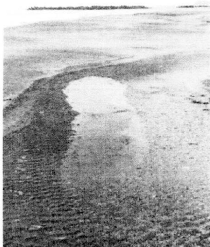
砂浜の潮だまり(日在浦6/19) サメの稚魚も時折見られる

このところ日在浦では、大潮の干潮の際、潮間帯(満潮線と干潮線の間で1日のうちに陸上になったり海中になったりする場所)に潮だまり(Tide pool)ができます。6月19-20日には4cm位のカタクチイワシの稚魚がたくさん取り残され、潮だまりの中で泳ぐ姿を見ることができました。また砂浜に打ち上げられてそのまま日干しになるものも見られました。年々砂浜が狭まってきて、数年前まで60m位あった潮間帯の幅が半減しています。また渚線付近が斜度20度にもなる場合があり、時折段差1.5-2mの浜崖ができた埋まっています。