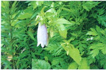
ヤマホタルブクロの花

釣鐘状の花の中にホタルを入れて遊んだところからその名がついたとか。白や薄紅色の花弁を透してほわほわと光るホタルの灯火……。闇の深かったその昔、ホタルの灯は子ども達の心にも、やさしい明りをともしたことでしょう。