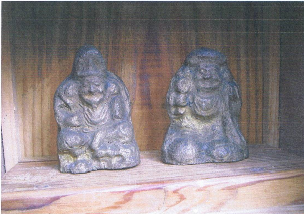
旧夷隅町引田の関通明家の台所に祀られている恵比寿神(左)と大黒神。

10月の別名は“神無月(かんなづき)”。出雲大社に全国の神様が集まり、出雲以外に神様がなくなる月の意で、出雲では“神在月(かみありづき)”と言うそうです。さて、この神無月の留守を預かるのが、七福神の一柱、恵比寿神です。右手に釣り竿、左手に鯛を抱えた福々しい姿で表わされる恵比寿神は、古くから漁村で