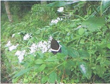
ヒヨドリバナとホタルガ

ハス園には、花を終え、蜂の巣のような実をつけた ハス の下に、 コナギ が紫色の花をひっそりと咲かせていました。湿性生態園に向かう道路脇の斜面には、 ヒヨドリバナ が小さくて白い花をたくさんつけています。そこには黒い羽に斜めの白いラインが入った ホタルガ が蜜を吸いに来ていました。湿性生態園には、 アキノウナギツカミ 、 シロバナサクラタデ 、 ユウガギク が咲いています。万木沼には冬鳥の カモ が早くも少数飛来しているようです。9月から10月は、夏から秋への変化が観察できる楽しい季節です。