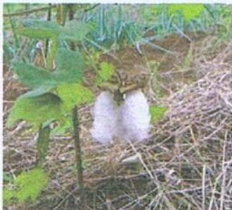
ワ タ (アオイ科)

平均気温：23.0℃、最高気温：31.1℃、最低気温：14.5℃、平均湿度：70.5%、雨量（積算）：89mm