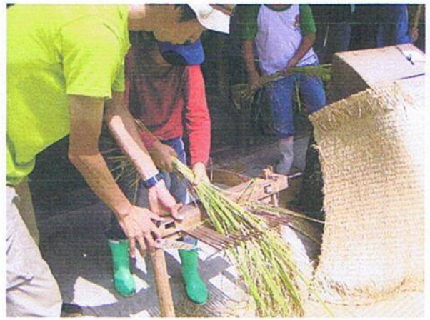
千歯こき(左)、足踏み脱穀機(右)に初挑戦

余った時間で明治、大正、昭和初期に使用されていた千歯こき[横木に固定した鉄歯でイネ束をこぐようにして脱穀する機械。江戸時代から明治、大正時代まで使用された]や唐箕(とうみ)[羽根車を回して風を起し、モミとゴミを選別する機械]など、昔の農機具体験が行われました。「ああこれ！懐かしい」という人や「面白そう、やってみたい」と目を輝かせる子どもらで、農機具体験は行列ができるほどの盛況ぶりでした。その後、各自思い思いの場所でセンター手作りのお味噌汁と持参のお弁当を広げて昼食をとり、その後自由解散となりました。