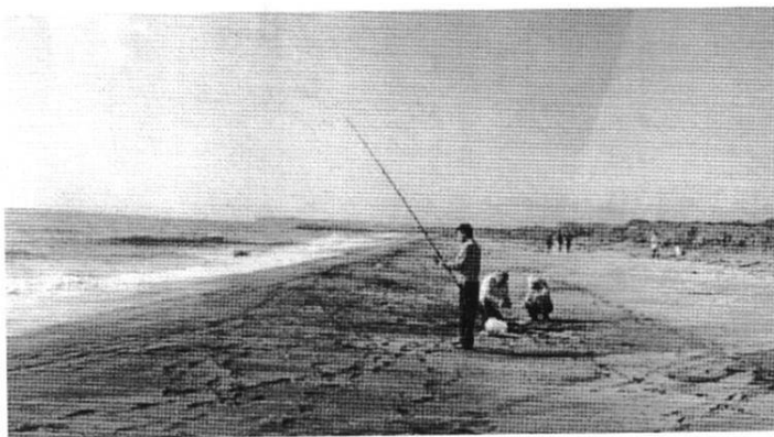
太公望も集う夷隅川河口左岸海岸(9月23日)

今年度いすみ市ではアカウミガメの大陸確認は17回、産卵は10回、孵化9ヶ所で、10月1日までに市水産班は筆者らと共に3回に分けて孵化調査を終えました。