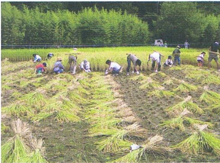
刈り取ったイネはその場でおだ架け用に束ねられてゆきます

「中止して後悔するよりも、決行しよう」とういセンター長の判断で催行が決定されました。結果は大正解！もう少し曇っていた方が良かったのに・・・、と思うほどの上天気恵まれました。