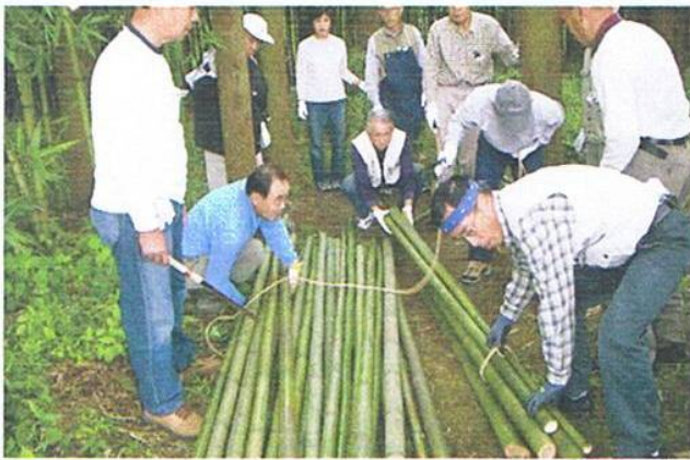
今回初めて実施された竹の切り出し作業