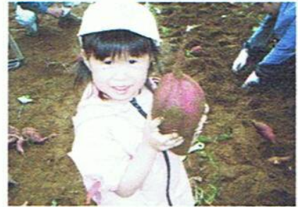
こんなに大きなオイモがとれたよ。

次は移植ごてを手に、いよいよサツマイモの掘り出しです。5月の半ばに植えられたサツマイモは、ベニアズマとコトブキの2種類。今年の夏は雨が極端に少なく、生育が心配されていました。が、掘り出してみると、生育は例年並みでした。「イモづる式に・・・」と言われるように、一本のつるに大小のサツマイモがついた状態で掘り出されてゆきます。自分の顔ほどもある大きなサツマイモを掘り出して歓声を上げる子。土の