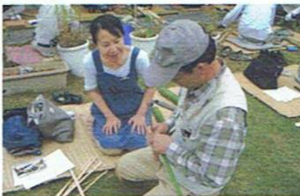
ひごを作る講師の手元にうっとり

5回におよぶ「竹かご教室」は、雨の日が一日あっただけで、おおむね好天に恵まれました。23名の参加者のうち、過半数の方々が全回を出席し、筏底のかごと六ッ目かごの二つのかご作りにいそしみました。