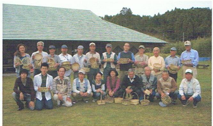
5日間のひごの格闘を経て作り上げた竹かごを手に全員集合。