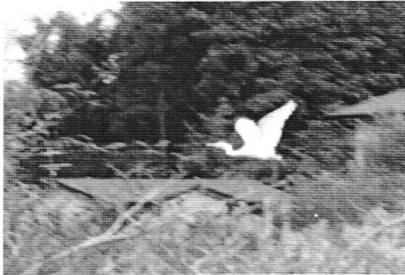
ダイサギの飛翔(江場土、10/13)