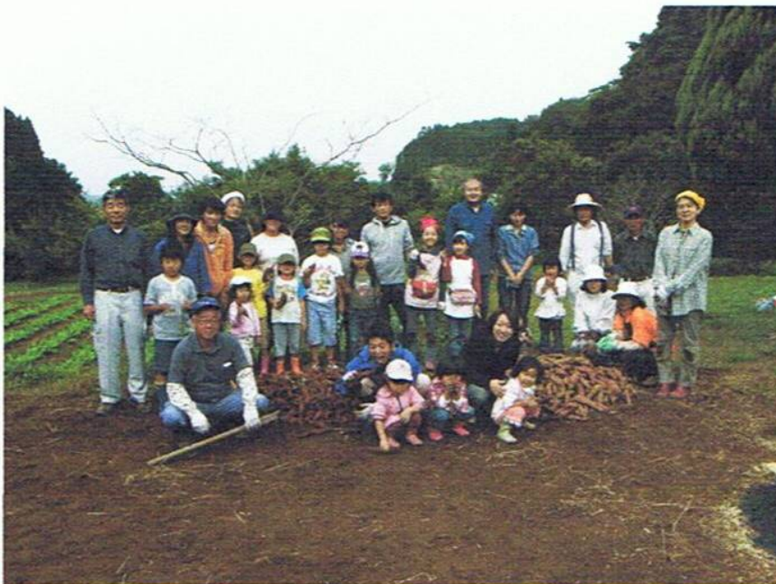
収穫したサツマイモと参加者。焼き芋として味わい、残りはお土産として持ち帰りました

全部掘り上げると、こんどは焼き芋作りです。1人あたり数本のサツマイモをきれいに洗い、濡らせた新聞紙で包み、さらにアルミ箔で包んで準備はOK。早朝からモミガラを燃やして燻炭とした中へ押し込んで、待つこと30分。焼き芋のできあがりです。美味しそうな、いえ、本当に美味しいホッカホカの焼き芋をその場で頬張り、皆心からの笑顔で行事を終えました。