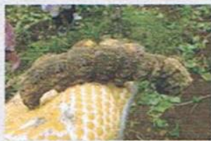
エビガラスズメ <幼虫> (スズメガ科)

平均気温：18.1℃ 最高気温：25℃ 最低気温：7.2℃ 総雨量：196.7mm