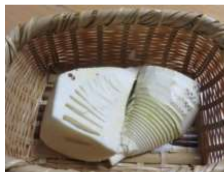
皮をむくとこんなに小さくなる

皮をむいたタケノコ一本につき、一握りのヌカを入れ、水からゆでる。ヌカが手に入らない場合は米のとぎ汁でゆでてもよい。ゆでる時間は大