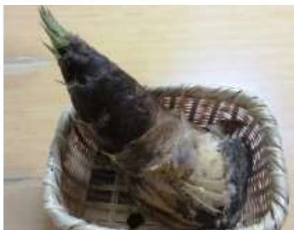
孟宗竹(モウソウチク)のタケノコ

タケノコは南房総を代表する食材の一つだ。ここ最近では「タケノコ掘り」は人寄せイベントの一つとして、地域の活性化に一役買っている。いすみ地域に住んでいるとタケノコの時期(4月の終わりごろ)には近所からタケノコが届く。タケノコと言っ