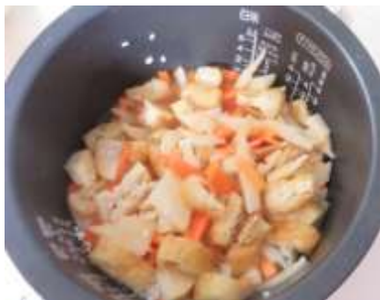
炊く前にざっくりとかき回す

各材料を切る（ニンジン・油揚げは短冊切り、タケノコも大きさをほぼそろえる）。米 2 合分とぎ、30 分置く。30 分経ったら切っておいた材料と調味料をおかまに入れ、熱が均等にいきわたるようにさっくりとかき回す。あとは炊飯器で米を炊く。炊きあがり間近になると部屋中がタケノコの良いにおいで満たされる。