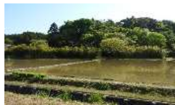
植え代かけ後のようす

落ち着きと床土の程よい硬さを得るため、田植えの 14 日前頃に行い、田植えまでは一定の水位を保つように水の管理を行いました。以降は田