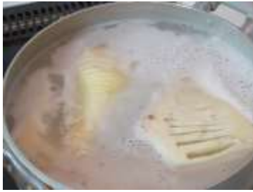
米のとぎ汁で煮る

きさなどで様々だが、竹串がすっと通ることが条件だ。ゆで汁につけたまま自然に冷ましアクをぬく。粗熱が取れたら料理にとりかかる。量が多く保存する場合は、ゆで汁に浸したまま一晩置き、翌朝水で洗い冷蔵庫で水に浸して保存する。水は毎日取り換える。