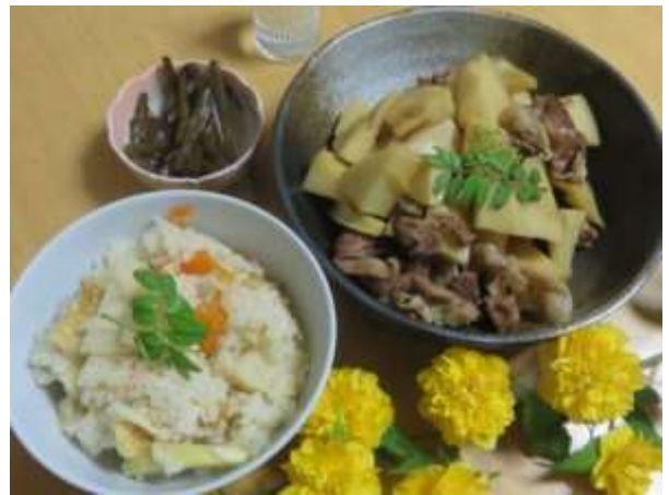
食卓に庭に咲いていたヤマブキを添えて

タケノコ・肉を切り、フライパンを熱し油をひく。油がフライパン全体にいきわたったらタケノコと肉を入れ炒める。火が通ったら調味料を入れ弱火でふつふつと煮る。タケノコに少し色がついたら出来上がり。