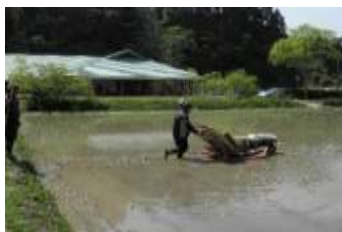
機械による田植え

5月2日(火)、月見モチ、京都神力の田植えを田植機により職員で行い、田植えがすべて終了しました。使用した苗はコシヒカリ20箱、月見モチ4箱、京都神力5箱となりました。